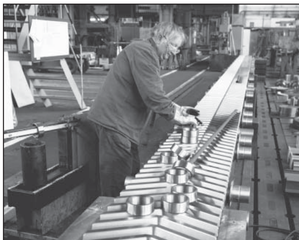
Časť pojazdného hrebeňa pre ťažnú stolicu je vyrábaný ako náhradný dielec pre ťaháren rúr Železiarne Podbrezová

ách je jedinečnou príležitosťou na výmenu najnovších technických i obchodných poznatkov a na nadviazanie kontaktov medzi odborníkmi z celého sveta.