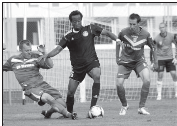
Najviac gólov (7) padlo do brány Lučenca v domácom zápase 5. mája.