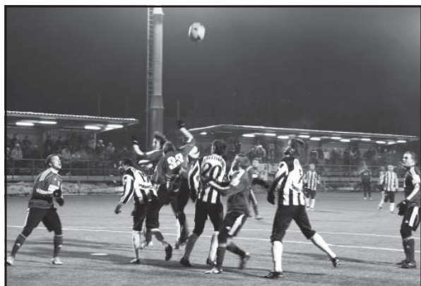
Príprava na jamú časť sa uskutočnila po prvýkrát doma na umelom trávniku na Skalici