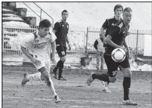
Prvý domáci zápas s Liptovským Mikulášom bol ešte v mrazivom počasí