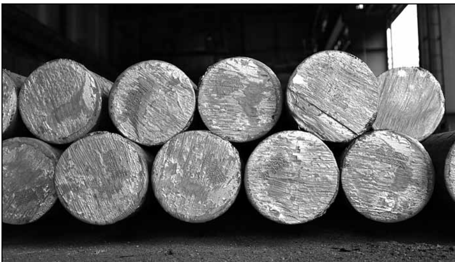
Kruh 240 mm liaty v zrekonštruovanom ZPO.