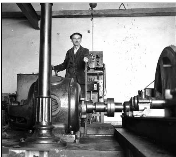
Interiér strojovne, kde posun huntíkov riadil aj pán Kováč.