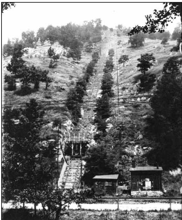
Pozemná lanová dráha viedla na západný výbežok vrchu Brezová na tzv. Šiklov