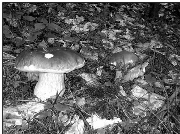
Jedni tvrdia nerastú, druhí, že rastú. Pravda je taká, že na určitých miestach sa dubáky vyskytujú, čoho dôkazom je snímka M. Mikloška z minulého týždňa.

prípravy žiakov pre potreby vedomostnej spoločnosti, na ktorý SG ŽP získalo grant z (Pokrač. na str. 3.)