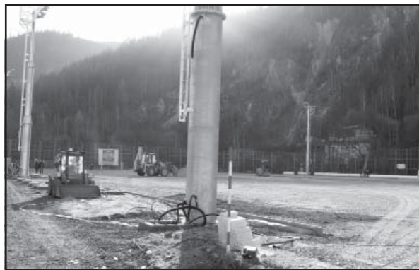
Na Skalici bude umelý trávnik.

trápiť niekde na spodku tabuľky tak, ako teraz, keď U-19 prezimuje na 13. mieste a rovnakú pozíciu obsadil druholigový dorast (U-18). U-15 starších žiakov skončila v I. lige na treťom mieste a od lídra tabuľky Žiliny ich delia len tri body. Všetky mládežnícke tímy sú svojimi výkonomi na výbornej úrovni a do budúcnosti