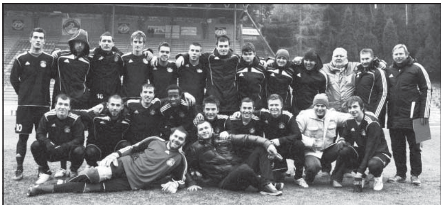
Prezimujú na druhom mieste.

- Nadvižem na predchádzajúcu otázku - mládežnícka základňa má neustále stúpajúcu hernú kvalitu. Myslím si, že najväčším prínosom pre ich zimnú prípravu, ale aj ďalšie tímy nášho klubu bude umelá tráva na Skalici. V etapách budujeme toho ihrisko na moderný štadión. Už druhý mesiac sa pracuje na kladení umelého trávniku, osvetlení