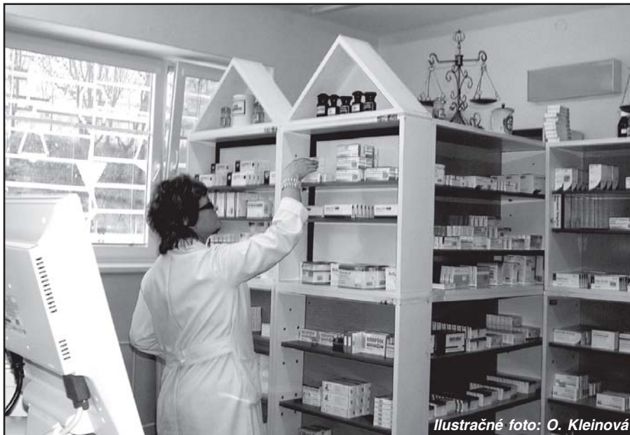
Ilustračné foto: O. Kleinová