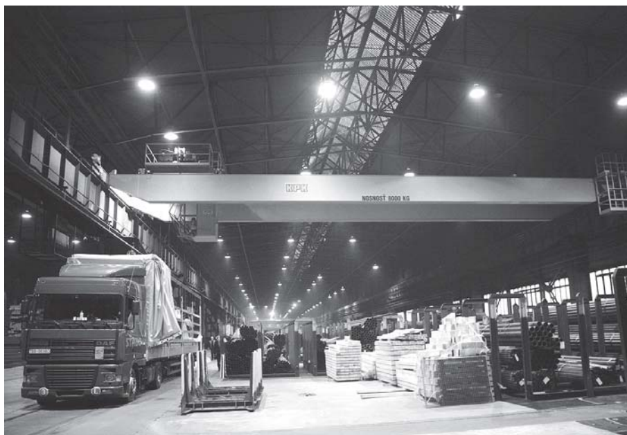
Nový osemtonový žerjav vo valcovni bezšvíkových rúr.