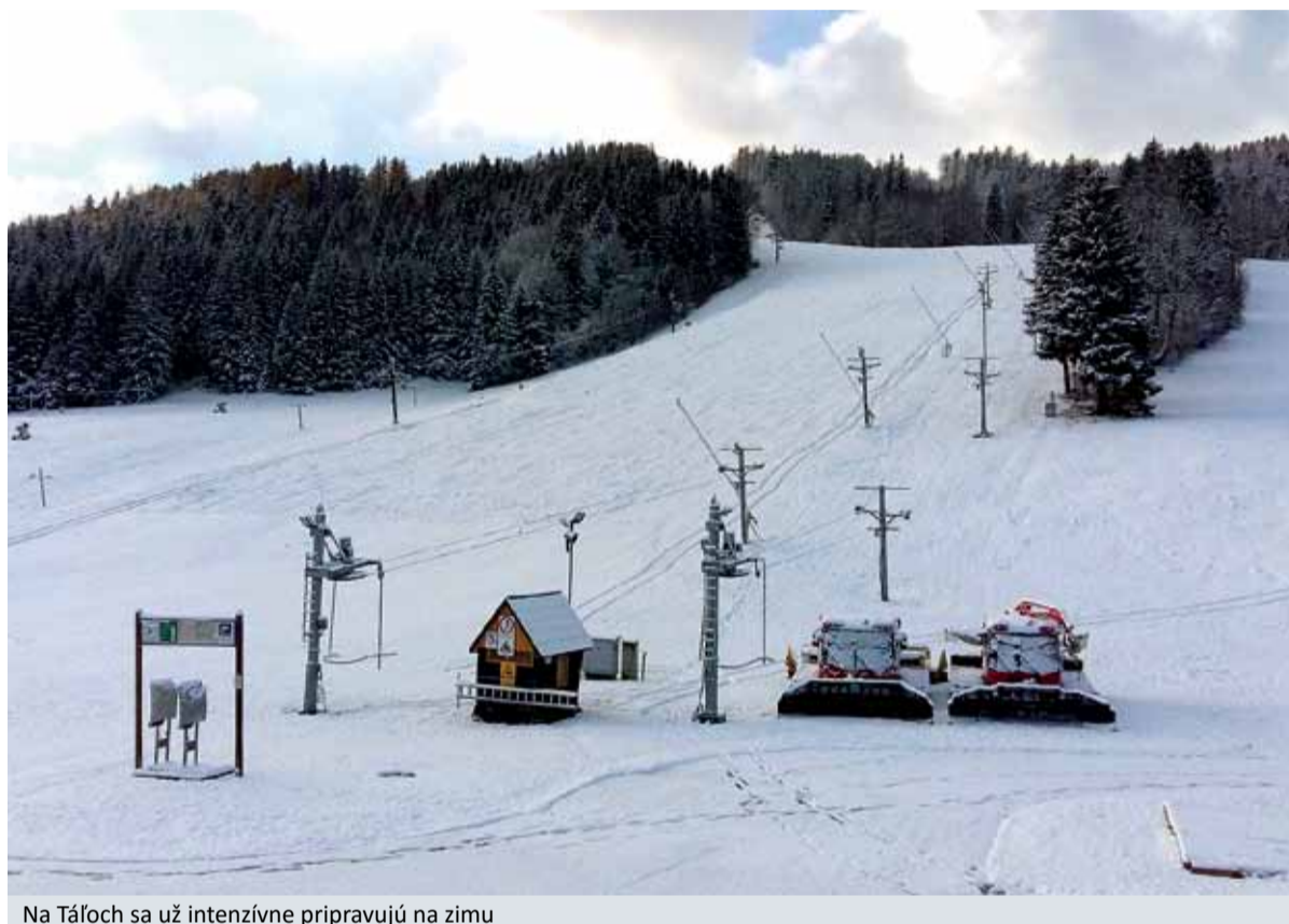
Na Táloch sa už intenzívne pripravujú na zimu

- Z roka na rok pribúda bežkárov. Chceli by sme pripraviť trate aj na Little Bear a poskytnúť možnosť lyžovania na bežkách pri umelom osvetlení v rámci večerného lyžovania. Treba však len dúfať, že snehové podmienky nám to umožnia. Na umelé zasnežovanie bežeckých tratí zatiaľ vybavení nie sme.