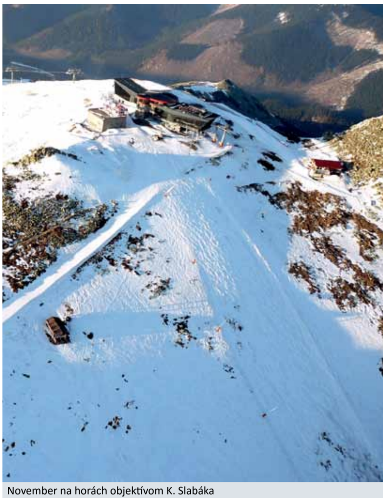
November na horách

Vianočná mzda bude vyplatená vo výplate za mesiac november 2017 pod mzdovým druhom 1414 a podľa zmluvy spolu s ostatnými zložkami mzdy daňovému a odvodovému zaťažaniu.