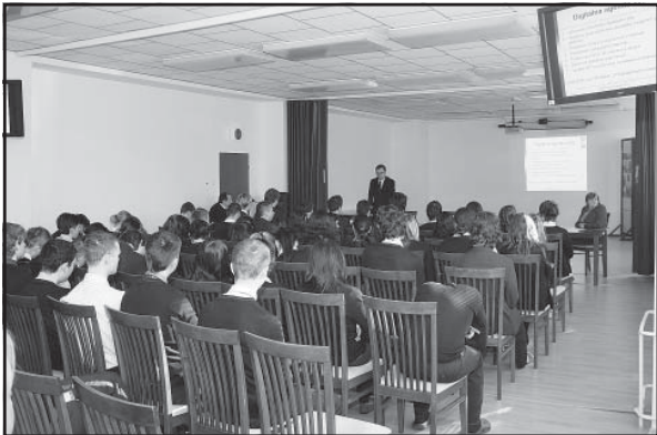
Účastníci besedy

k histórii, vzdelávaniu a športu. Po prehliadke areálu Súkromnej odbornej školy hutníckej ŽP a Súkromného gymnázia ŽP sa s nimi Dušan Čaplovič rozlúčil slovami: „Navštívil som už mnoho súkromných škôl, no z tejto odchádzam duchovne obohatený v tom dobrom slova zmysle, veď projekt, ktorý sa realizuje v Železiarňach Podbrezová a.s. s prepojením na túto firmnú súkromnú školu, je úspešný. Považujem ho za nasledovania hodný aj v iných regiónoch a myslím si, že nemusíme pripravovať ďalšie pilotné projekty, no hľadať poučenie v tomto prostredí - v oblasti odborného školstva. Pokiaľ sa budeme môcť v budúcnosti rozhodovať, určite sa oprieme o vaše skúsenosti.“