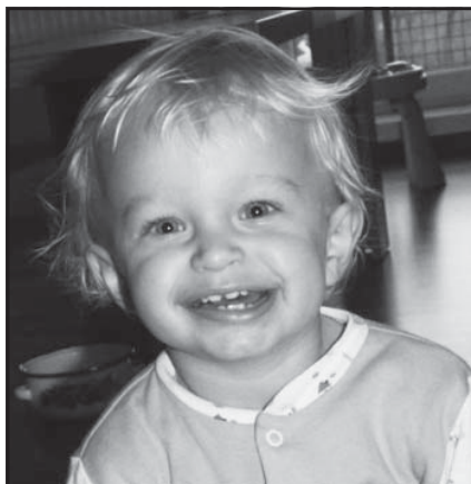
Hurá, už príde jar...

Volebné právo je naša povinnosť. Občianska, ale aj morálna. Ak máme svoj názor, mali by sme ho vyjadriť. Ak sa volieb nezúčastníme, budeme si vyčítat, že sme nevyužili šancu niečo zmeniť a zároveň zvýšime šancu tým, s ktorými nesúhlasíme. Predčasné parlamentné voľby sa uskutočnia 10. marca od 7. do 22. hodiny. Nezabudnite si so sebou zobrať občiansky preukaz.