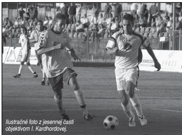
Ilustračné foto z jesennej časti objektívom I. Kardhordovej.

- V prvom rade je skonsolidovať nový kolektív, ako sa hovorí - ofukať mladých hráčov v súťaži a v ďalšom ročníku zaútočiť na popredné priečky tabuľky. Tento ročník treba brať reálne, ide o nový tím, počítať treba i so slabšími chvíľkami avšak veríme, že mladí hráči zvládnu psychický tlak a prerazia v súťaži. Čo nám prezradíte o diani v mlá-