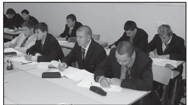
Odborná učebňa strojárskych predmetov