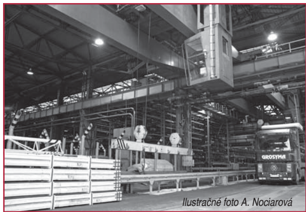
Ilustračné foto A. Nociarová

krát, prijali sme opatrenia k 3 835 nedostatkom, ktoré boli následne odstránené. K najsledovanejším oblastiam patrili prístup zamestnancov k práci, ich zodpovednosť voči svojmu a zdraviu svojich spolupracovníkov. Z 573 kontrol na požitie alkoholických nápojov (pri ktorých bolo skontrolovaných 4205 zamestnancov) vyplynulo až 21 prípadov s pozitívnou skúškou, čo bolo hodnotené ako porušenie pracovnej disciplíny zvlášť hrubým