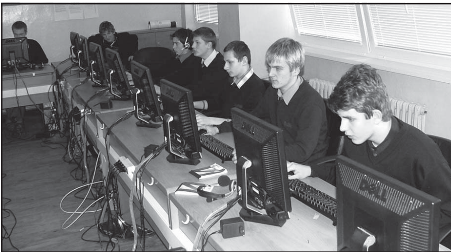
Multimediálna učebňa na výučbu cudzích jazykov

· odbor určený pre chlapcov a dievčatá, · absolvent je kvalifikovaný technický pracovník pre prácu technologického, montážneho a prevádzkového charakteru.