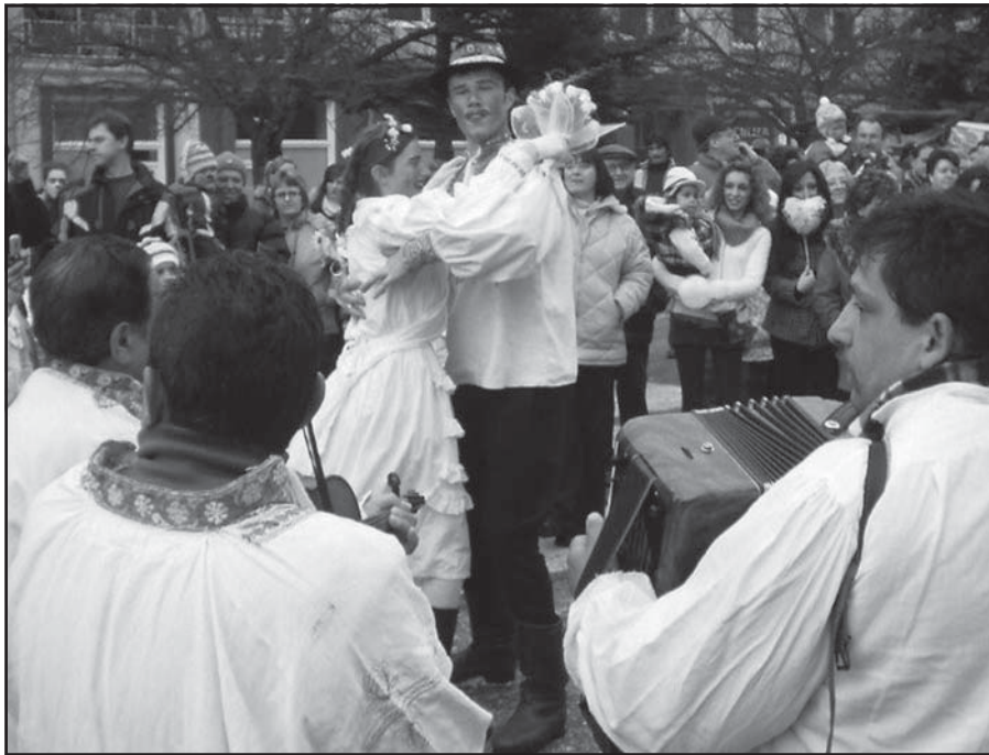
Pôstnemu obdobiu predchádzali Fašiangy. Veselie vo Valaskej