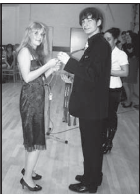
V našich školách je dostatok priestoru aj na zábavu. Nedávno sme absolvovali Valentínsky ples v Dome kultúry ŽP