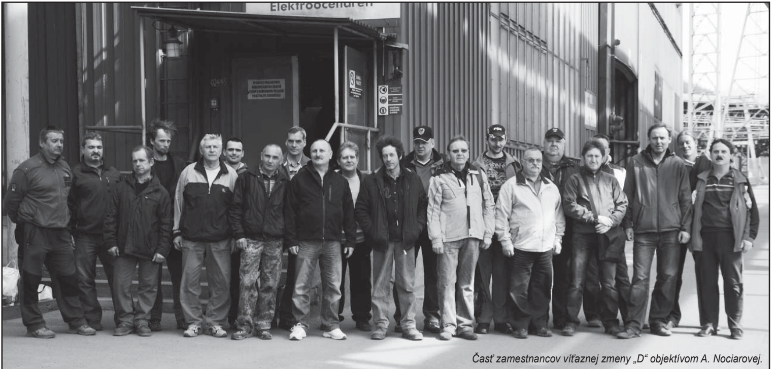
Časť zamestnancov víťaznej zmeny „D“.